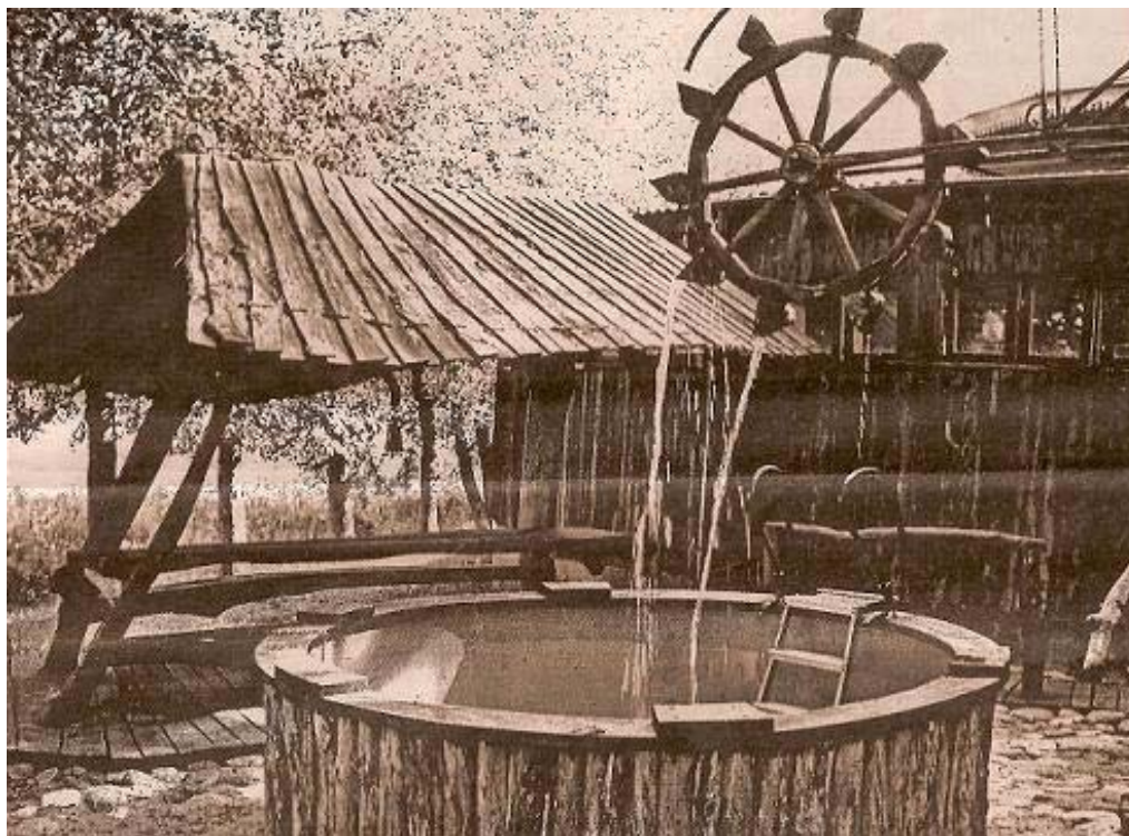
Kiekvienas „Bičnamio“ kampelis unikalus. Jums karšta? Štai dušas ir baseinas.