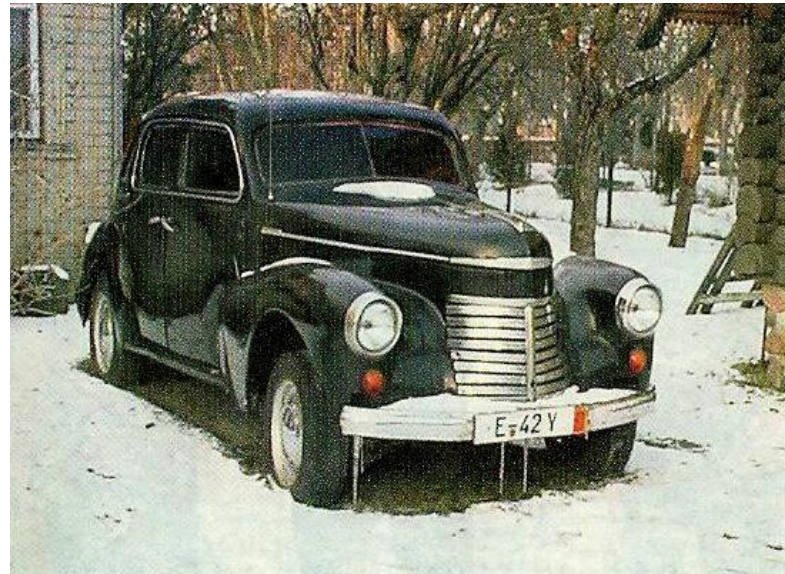
Tokie automobiliai prieš 50 metų buvo laikomi Vokietijos ekonomikos pasididžiavimu.