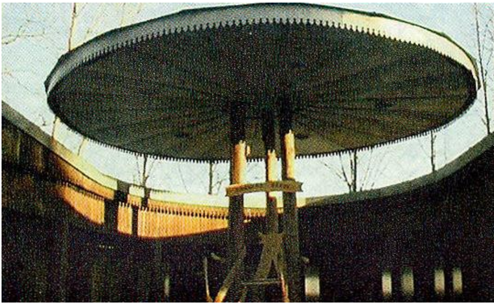
Pavėsinės stogas aplinkiniams primena skraidančią lėkštę. Po juo – „Krėslas bosui“